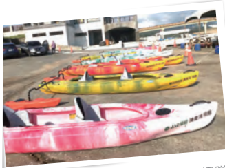
▲永達保經及各級長官與保戶共捐贈11艘身障專用獨木舟，2022年11月13日於福隆首發下水。