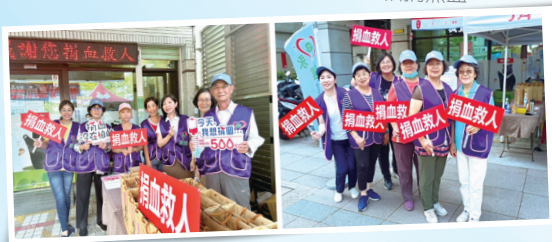
▲永達志工邀請您加入捐血人行列。