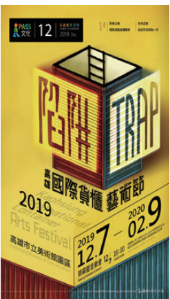
高雄國際貨櫃藝術節

而在關注世界性議題的同時，更運用開創式的藝術手法，結合設計、時尚、視覺與科技等媒材與手法，開展跨族群、跨領域的多元性對話。美術館也藉此充分扮演國際藝術平台