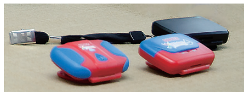
三煙電子與美國及加拿大廠商合作推出的健康管理器。

將其運用在醫療體系，向當地健保單位申請將健康管理器作為「處方簽」，當醫師根據病患情況給予運動處方時，可以透過健康管理器了解病患是否有確實依據處方做運動，透過追蹤督促病患確實達到運動目標，讓醫師開立的運動處方得以落實。