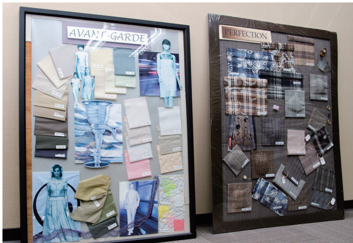
針對前衛及完美風格打造布料樣本作品。

「快時尚」是永茗企業的核心精神，為了走在時尚尖端的前面，站穩「開創創新」的路線，永茗每年都會參加義大利、米蘭等地舉辦的時尚展，同時也前進西班牙、巴塞隆納等知名服裝品牌的發源地進行考察，了解市場趨勢，謝