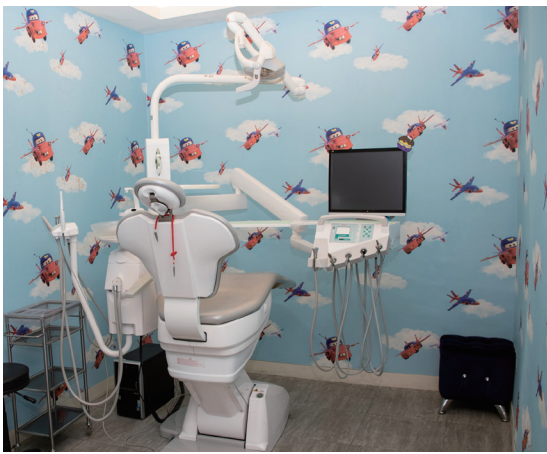
兒童牙科專屬診療空間，充滿童趣。