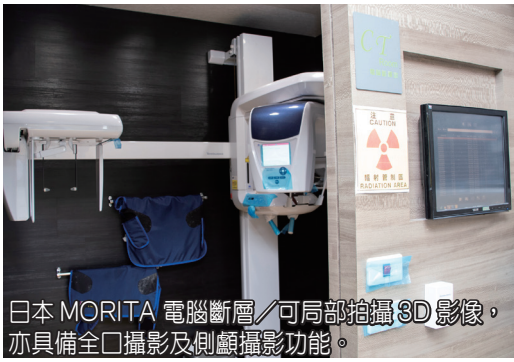
日本 MORITA 電腦斷層 / 可局部拍攝 3D 影像，亦具備全口攝影及側顱攝影功能。