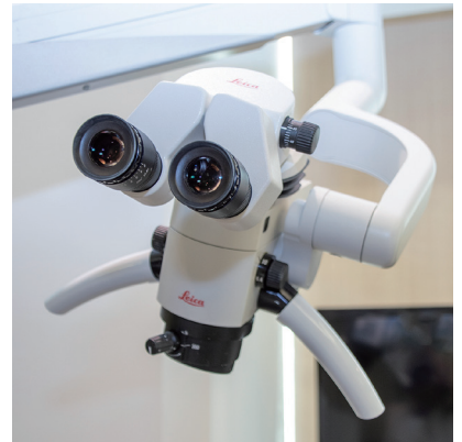
顯微鏡／適用於顯微根管、顯微手術，給患者更精細確實的治療品質。

診區旁更配置日本 Parana 治療型自動電子血壓計，供患者隨時量測，讓有高血壓、心臟病等相關病史的患者看診時更安心。