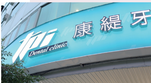
康緹牙醫診所主要服務三重地區的民眾。

美國 DENTOL 根管用電動馬達、法國 ACTEON 超音波機、荷蘭 Dips 生命監視器、美國 SoanX 讀片機、荷茂 Moritex 內攝影機、荷茂 Moritex 光固化機、日本 MORTAX 光機、日本 MORTA 根管測量儀、日本 MORTA 電腦斷層、義大利 Artos 治療椅、美國 ZN ESPE 牙材、顯微鏡、日本 Parana 治療型電子血壓計、醫療級 RO 濾心等