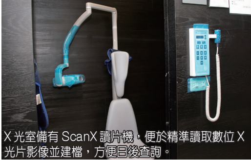
X光室備有 ScanX 讀片機，便於精準讀取數位 X 光片影像並建檔，方便日後查詢。