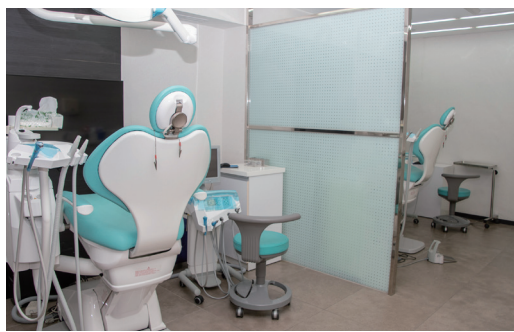
為提升專科醫師看診效率，備有雙診療椅的治療室，可快速切換治療，無須等待醫材準備時間。

可精確測量根管長度，讓醫師快速判斷根管情況。 同時，康緹對於機台用水一點也不馬虎，全面供應經藍海淨水濾心過濾的 RO 淨水，一樓候