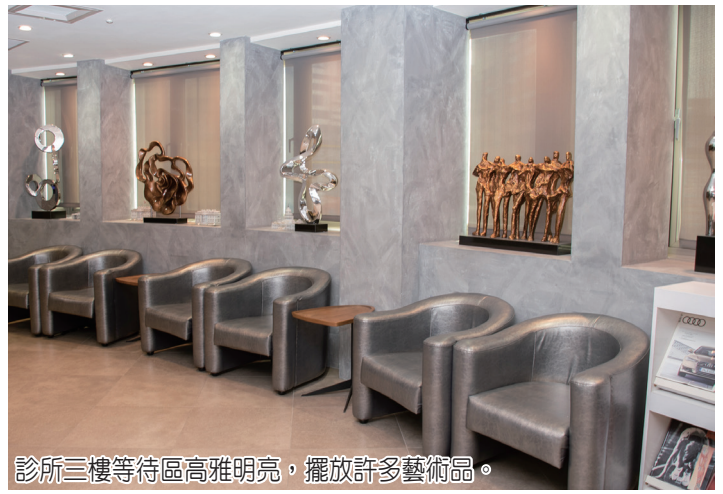
診所三樓等待區高雅明亮，擺放許多藝術品。

可精確測量根管長度，讓醫師快速判斷根管情況。 同時，康緹對於機台用水一點也不馬虎，全面供應經藍海淨水濾心過濾的 RO 淨水，一樓候