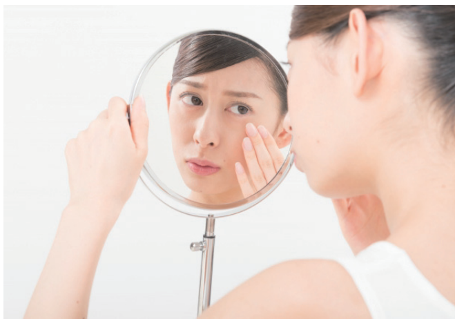
想解決臉上的惱人斑點，務必請醫師先進行診斷。

曬斑、肝斑、顴骨斑等，必須先診斷是屬於表皮斑或真皮斑，治療表皮斑與真皮斑的雷射波長就會有所不同，斑的量及分布位置都會牽涉到治療方式與計畫。