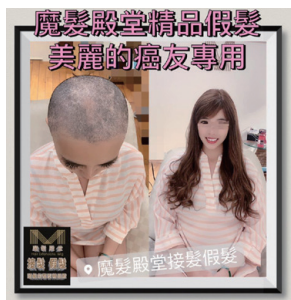
魔髮殿堂真人髮絲精品假髮案例。