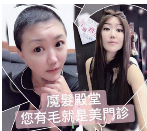
摩根教主剃光頭體會客戶感受。