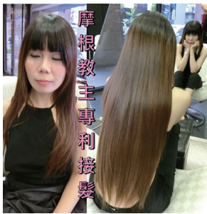
魔髮殿堂接髮案例。

挾著完整的學能素養及豐厚的專業底蘊，摩根教主希望能夠傳承專業，擴大服務範圍，並且建立個人假髮品牌，然而一個人的力量畢竟微薄，期許未來能夠有機會與知名連鎖集團合作，擔任教育講師，系統化傳授專業技能，攜手打造共好的未來願景。