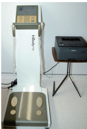
InBody 770 精準身體組成分析儀

射)：為頂尖的雷射淨血療法，廣為國內各大醫學中心使用，以低能量的紅色雷射光，從手臂靜脈導入，讓血液宛如進行一場日光浴，有助於清除體內容易致癌的自由基，淨化血液、活化機能、清除毒素，改善慢性病與各種身體病痛。 【空氣】 1、診所內安裝十一台原裝進口大金冷暖變頻空調，維持最好的室內空氣品質。 2、高壓氧治療：與診所隔壁的中心綜合醫院配合，提供醫療等級高壓氧療程，可真正促進新陳代謝，逆轉慢性疾病的初症，促進腦細胞活化。 3、健康氫體驗：推廣氫分子保健，無縫接軌日本目前最秀的保健方式。