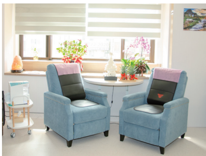
健康體驗區 (歡迎預約體驗)

驗，有益人體吸收，幫助維持健康。 2、點滴輸液療法：從德國進口必需胺基酸(補充優質蛋白質)及各種抗氧化劑、各式高單位維他命，從靜脈直接輸注營養物，對症補充每個人缺失的營養素。 運動音樂接地氣健康更UP 除了陽光、空氣、水這三大生存要素，劉院長還在診所內設立瑜珈教室與音樂治療室，以運動及音樂輔助，三六〇度無遺漏地提供最全方位的預防醫療。診所的護理師領有體適能證照，也提供了瑜珈、皮拉提斯、冥想、TRX、空中瑜珈等運動課程，藉由運動促進體內氣血循環；針對心理壓力大的客戶，劉院長更提供音樂治療，親自陪伴教導唱歌、聽音樂，藉此達到紓壓效果。最