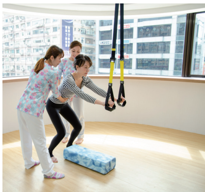
瑜珈教室 (歡迎預約打造健康)

驗，有益人體吸收，幫助維持健康。 2、點滴輸液療法：從德國進口必需胺基酸(補充優質蛋白質)及各種抗氧化劑、各式高單位維他命，從靜脈直接輸注營養物，對症補充每個人缺失的營養素。 運動音樂接地氣健康更UP 除了陽光、空氣、水這三大生存要素，劉院長還在診所內設立瑜珈教室與音樂治療室，以運動及音樂輔助，三六〇度無遺漏地提供最全方位的預防醫療。診所的護理師領有體適能證照，也提供了瑜珈、皮拉提斯、冥想、TRX、空中瑜珈等運動課程，藉由運動促進體內氣血循環；針對心理壓力大的客戶，劉院長更提供音樂治療，親自陪伴教導唱歌、聽音樂，藉此達到紓壓效果。最