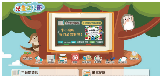
文化部兒童文化館（圖片擷取至網站）。

台，更是莘莘學子們精進自我的絕佳管道，舉例來說，台大開放式課程網站就推出中國文學系蔡璧名教授所開設的「正是時候讀莊子」線上課程；還有《新百家學堂》閩南語線上課程，講授閩南語語法結構及語言源流。大家可以依據自己的興趣、時間與能力，趁著宅在家的這段時間，自我充實成長。