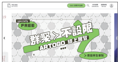
帶你看展（圖片擷取至網站）。