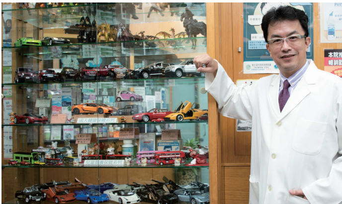
診所內的玻璃櫃擺放著蔡醫師最愛的收藏。