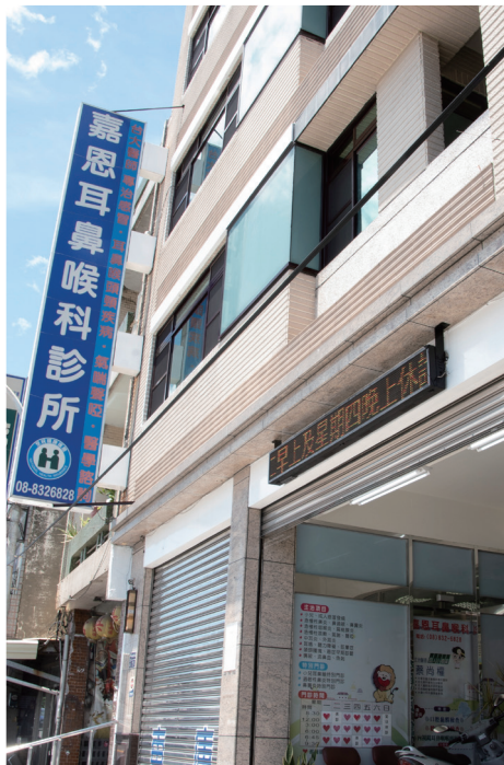
嘉恩耳鼻喉科診所位於屏東縣東港鎮中正路一段。

蔡醫師以紮實的醫療專業、無比的耐心及人親土親的連結，紮根東港，成為在地鄉親最信賴的家庭醫師，時刻給予最及時的協助與醫療上的照顧，期許陪伴所有東港鄉親一起健康呷百一！