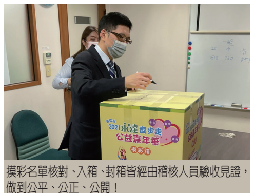
摸彩名單核對、入箱、封箱皆經由稽核人員驗收見證，做到公平、公正、公開！

這樣的方式健走，點點滴滴參與者於線上健走期間每日走三公里，個人累積三〇公里，甚至有位連續二年乘坐輪椅的參與者，今年同樣在家人陪伴下完走。不少參與者表示，疫情期間可以透過