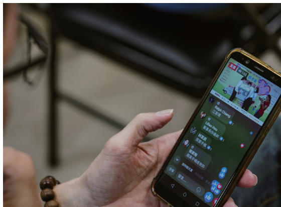
參加者在 FB 上看線上抽獎並留言互動。