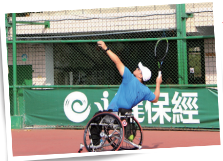
▲輪椅網球好手賽場上英姿。

除此之外，今年同時舉行身障運動嘉年華活動，除了網球賽事外，還舉辦輪椅羽球及輪椅壘球的賽事。我國在東京奧運羽球項目成績輝煌，尤其是