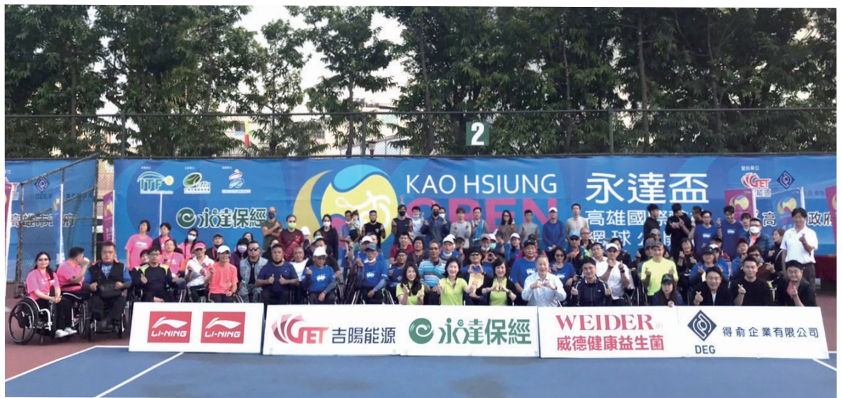
▲輪椅網球好手與所有貴賓大合影畫下完滿句點。

永達盃高雄國際輪椅網球公開賽暨身障運動嘉年華，於12月17日起連續三天在高雄市橋頭區竹林網球場及高雄市燕巢區滾水羽球場舉行，連續五年在高雄舉辦輪椅網球賽事，未因新冠疫情中斷，實屬不易。